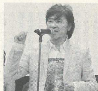
二度の脳梗塞に見舞われた西城秀樹