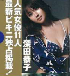
人気女優11人 最新ビキニ独占掲載 深田恭子 小島瑠璃子