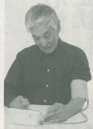
血圧値は左右で違う

は心臓から大量の血液を送り出す大動脈が、右半身に向かって出ているためです」(前出・菊池院長)