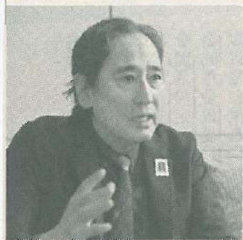
ラクナ梗塞が3ヵ所見つかったルー大柴氏

が、脳ドックを受ける人は依然として少ない。血圧が高めなら誰にでも起こりうる病気で、2年に1回くらいは脳ドックを受けたほうがいいと思います。胃カメラでポリプが見つかり、それが早期のがんで命拾いしたというケースは多いと思います。それと同じように、