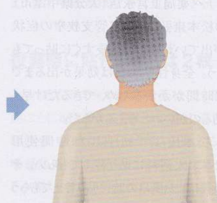
すぐに肌着を着せる