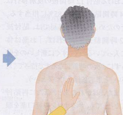
入浴後、保湿剤を貼付薬の上から背中全面にたっぷり塗る