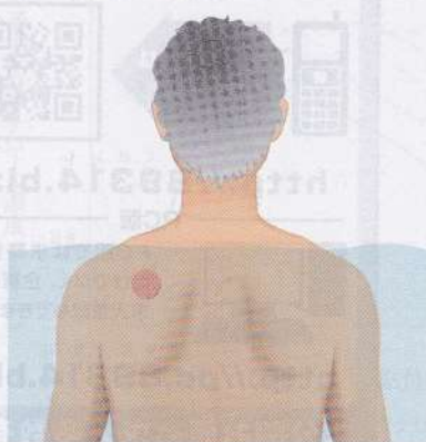
貼付薬を貼ったまま入浴