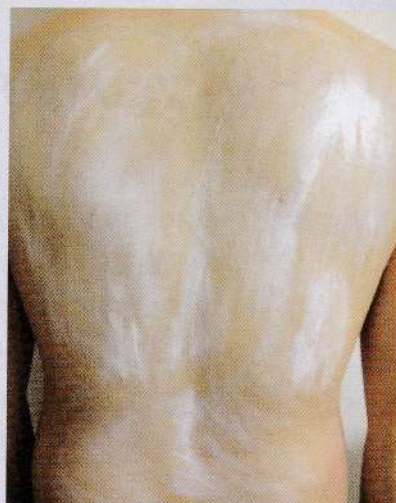
写真3 ヒルドイドクリーム of 塗り方

「リバステグミンの貼付薬は4週ごとに高用量のものへと替えていくが、9mg製剤を13.5mg製剤に替えたところでできめんにかぶれる」と、約250人の認知症患者にリバステグミンの貼付薬を処方する、くどうちあき脳神経外科クリニック（東京都大田区）院長の工藤千秋氏は述懐する。