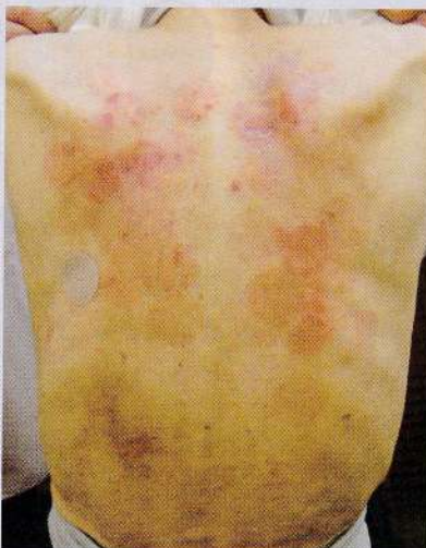
写真2 リバステグミン貼付薬による接触皮膚炎

遷延しやすく、写真2の患者のように、背中一面にスタンプを押したように赤みが残ってしまうケースもある。