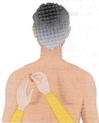
翌朝、貼付薬を剥がす