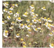
←ジャーマンです。 (安藤)

● ローマン ：色は薄黄色で甘酸っぱいりんごを想わせるような深い香り。エステル類というラベンダーと同じ化学成分を多く含んでいるので、安全で鎮静や鎮痛作用に優れています。その為、産前・産後、ベビーのケアにも活躍します。この香りは、怒りやヒステリー、不安などの感情を抑えたり、頭痛や消化器系の不調(便秘・下痢・吐き気等)を和らげます。一般的には 精神面 のケアによく使われています(^_^)